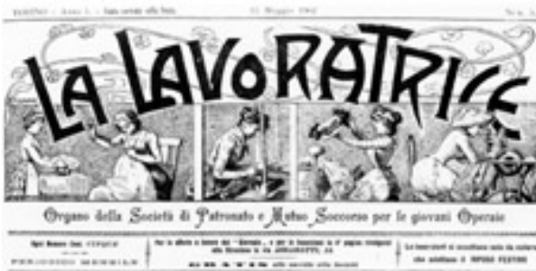
Organo della Società di Patronato e Mutuo soccorso per le giovani Operaie

In Italia si assiste al cd. “decollo amministrativo”, periodo che si caratterizza per l’azione di governo di Giovanni Giolitti. Dopo la crisi economico – sociale, ma soprattutto politico – istituzionale di fine secolo, nei quindici anni di governo, Giolitti attua la sua opera di riforma non caratterizzandola con l’introduzione d’imponenti leggi di mutamento dell’ordinamento precedente (com’era accaduto nell’epoca crispina), ma incentrandola sulla cd. “ administrative revolution ”.