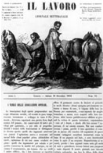
La stampa e i lavoratori

Nel 2001 la profonda trasformazione del quadro politico influenza i rapporti con le tre Confederazioni ed il persistente pericolo di divisione incombe sul fronte sindacale.