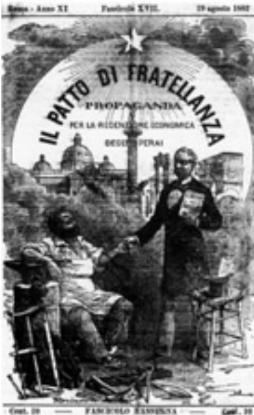
Propaganda per la rivoluzione economica

Alla fine del 700 già nascevano le prime società di mutuo soccorso come associazioni volontarie con lo scopo di migliorare le condizioni materiali e morali dei ceti lavoratori. Tali società si fondavano sulla mutualità, sulla solidarietà ed erano strettamente legate al territorio in cui nascevano.